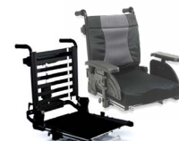
Rücken: ARH 2171