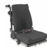
Rücken: ARH 2174, 2175