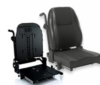
Rücken: ARH 2172 bzw. 2173